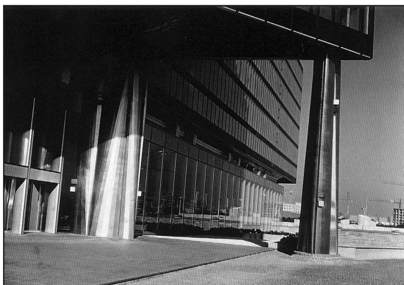
Porche monumental de l'entrée : points porteurs en béton revêtus de tôle d'acier inoxydable, œuvre de Touclas Philolaos.

Dans le plan de ce nouveau Créteil, des sablières non remblayées sont réservées afin de créer un lac, élément phare du parc départemental qui sera réalisé. C'est au bord de ce plan d'eau que s'implante la préfecture du nouveau département tel un vaisseau de verre, de granit et d'acier évoquant les valeurs de représentation de l'Etat : monumentalité, pérennité, modernité. A la manière d'une sculpture, cette longue barre coudée s'ouvre vers le lac. Le bâtiment se détache sur un socle transparent, alors que les volumes bas des services, plus massifs, ancrent l'ensemble dans la pente du terrain. Trois registres de façade se superposent, exprimant les différentes fonctions de l'édifice : le socle, correspondant aux espaces recevant du public, est transparent ; les étages courants, abritant les bureaux des différents