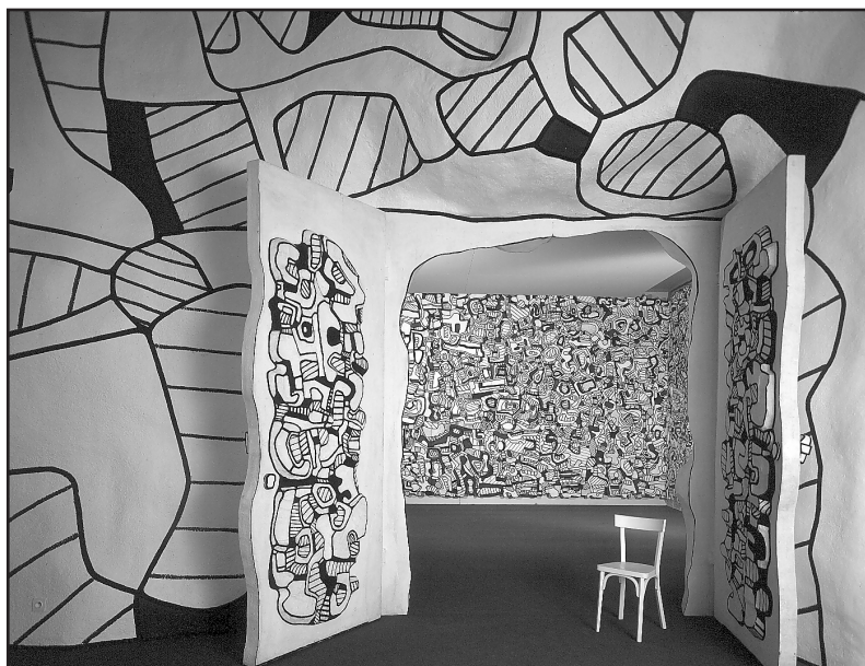
Entrée du cabinet logologique

L'Antichambre réalisée entre 1974 et 1976, installée au sein de la villa et menant au cabinet logologique, mesure environ 15 mètres de long et