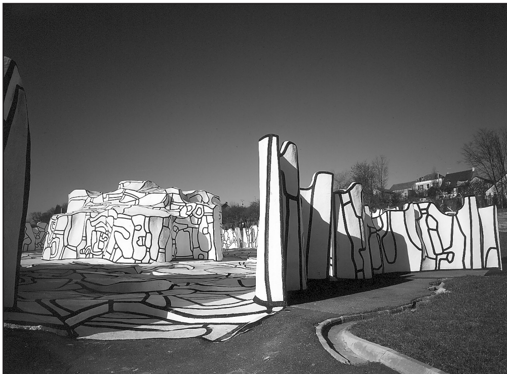
La closerie

En voiture depuis Paris : autoroute A 4 direction Nancy-Metz puis direction Provins-Troyes par N 19 jusqu'à Villecresnes